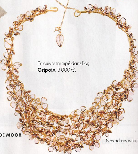
En cuivre trempé dans l'or, Gripoux , 3 000 €.