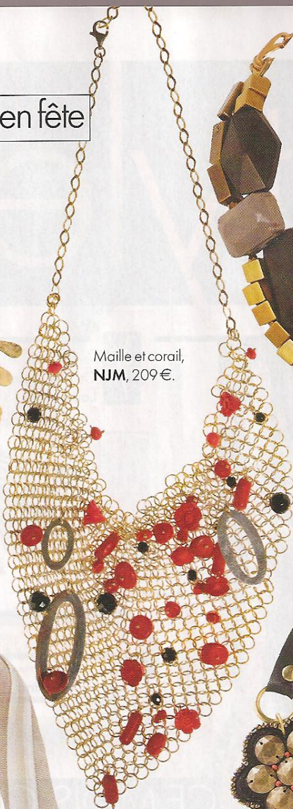
Maille et corail, NJM , 209 €.