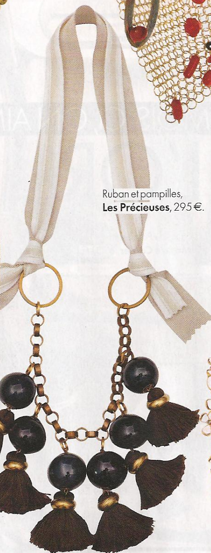
Ruban et pampilles, Les Précieuses , 295 €.