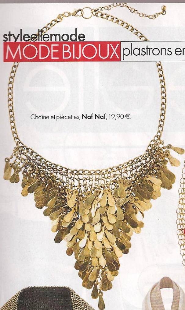
Chaîne et piécettes, Naf Naf , 19,90 €.