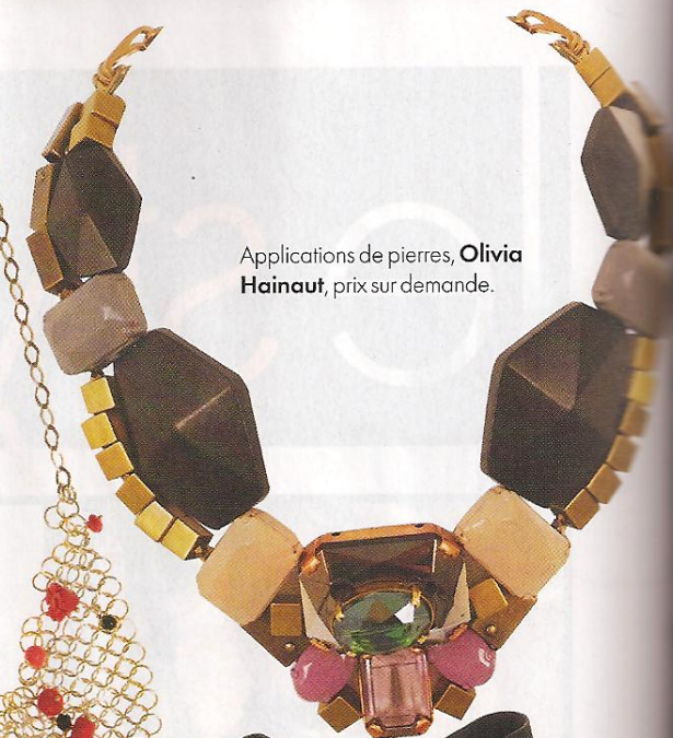
Applications de pierres, Olivia Hainaut , prix sur demande.