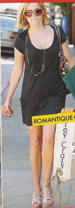
Lunettes nude, H&M, 9€.