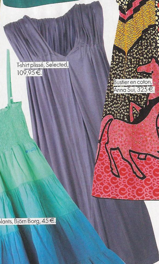
T-shirt plissé, Selected, 109,95€.