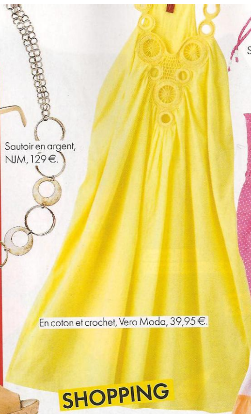
En coton et crochet, Vero Moda, 39,95€.