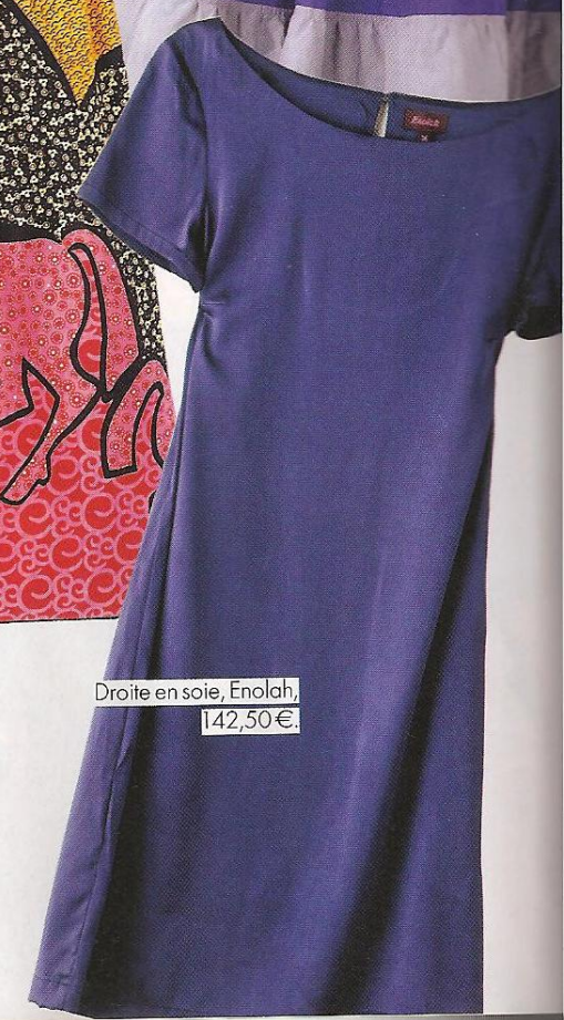
Droite en soie, Enolah, 142,50€.