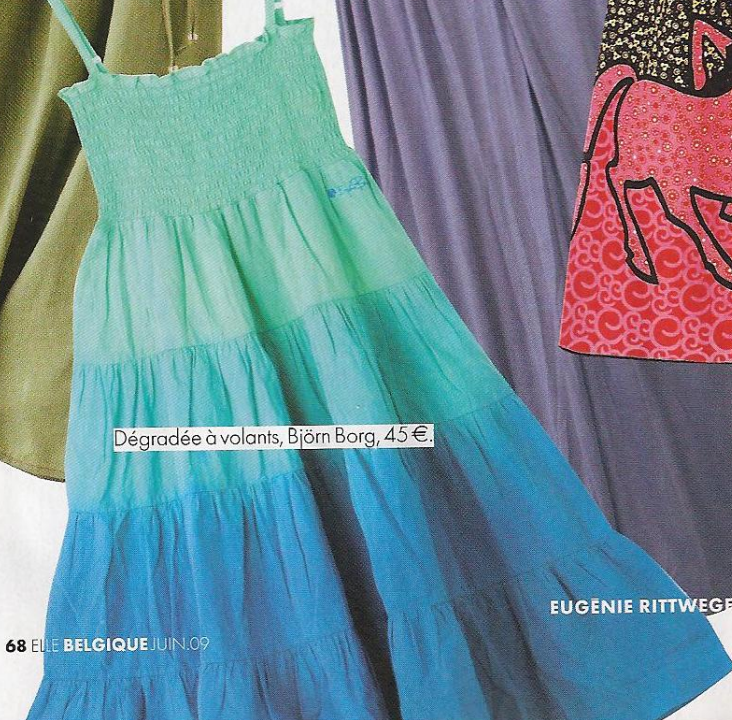
Dégradée à volants, Björn Borg, 45€.