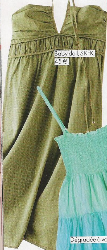
Baby-doll, SKFK, 45€.