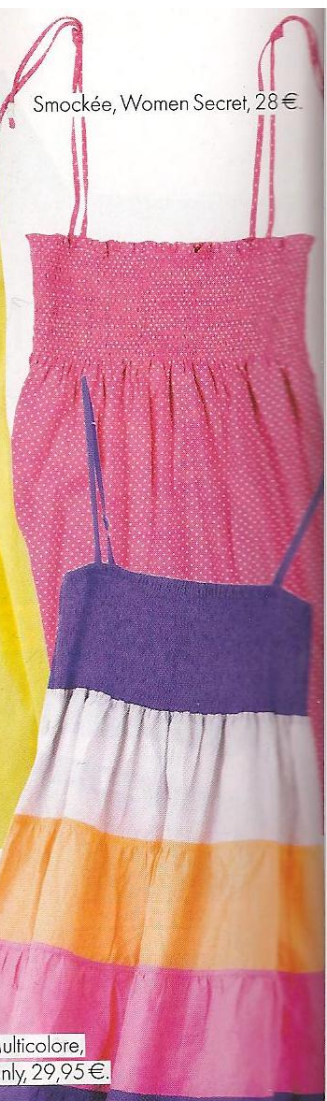
Multicolore, Only, 29,95€.