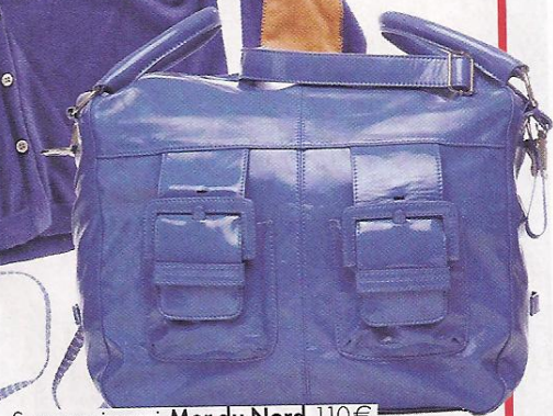
Sac en cuir verni, Mer du Nord , 110 €.