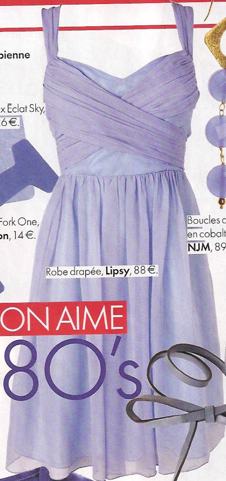
Robe drapée, Lipsy , 88 €.