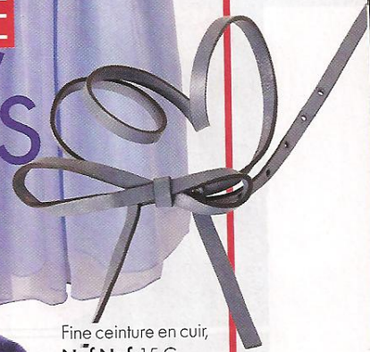
Fine ceinture en cuir, Naf Naf , 15 €.