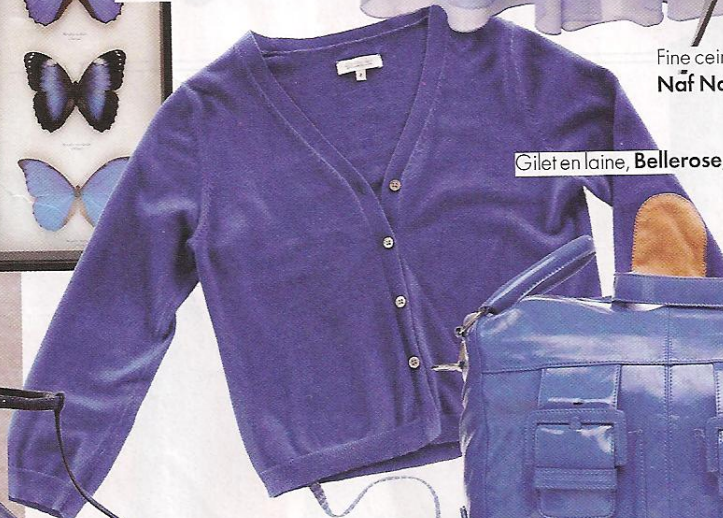
Gilet en laine, Bellerose , 104 €.