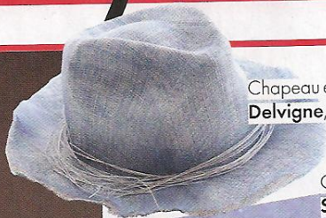
Chapeau en toile, Fabienne Delvigne , 280 €.