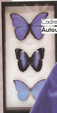
Cadre papillons, Home Autour du Monde , 28 €.