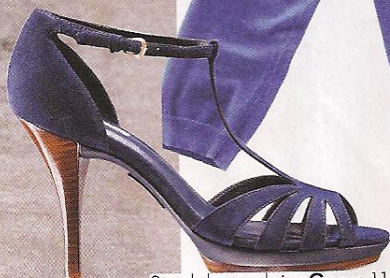
Sandalettes en daim, Geox , 119,95 €.